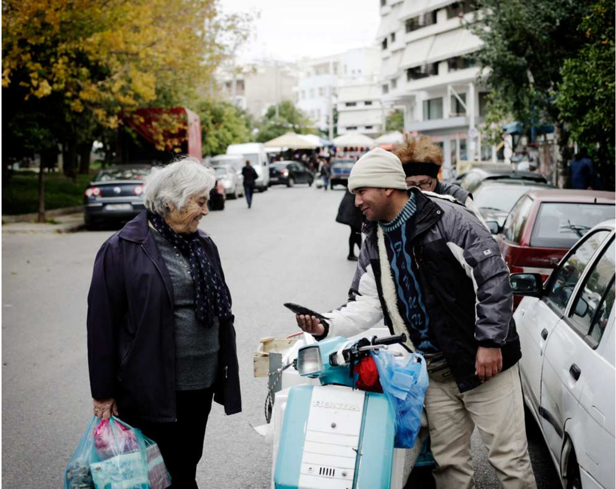
Figure 6. Sur les marchés, les femmes âgées sont les meilleures clientes des revendeurs égyptiens.