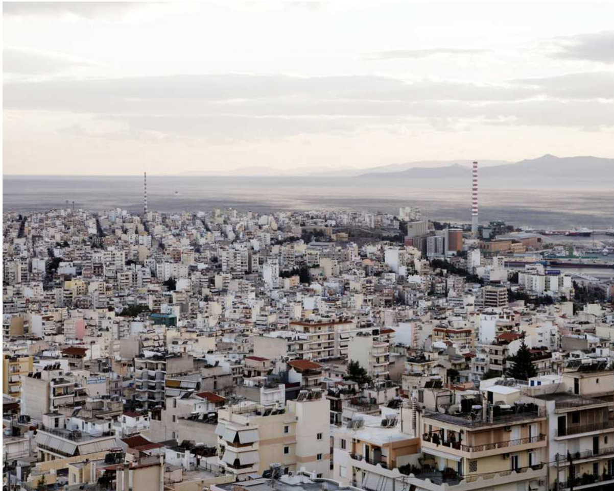
Figure 1. Keratsini.