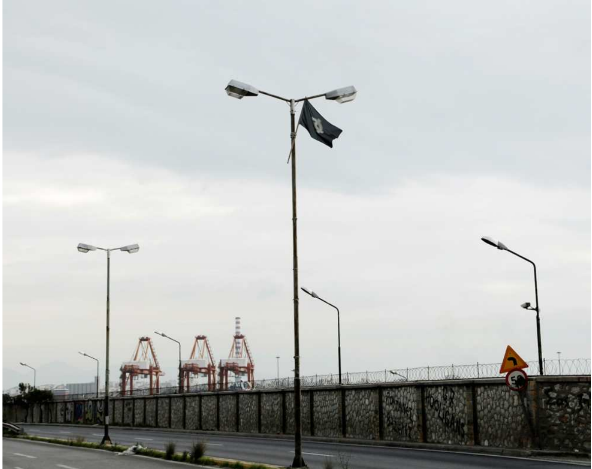
Figures 2. Un drapeau d'Aube dorée flotte accroché à un lampadaire près du port industriel entre Keratsini et Perama.