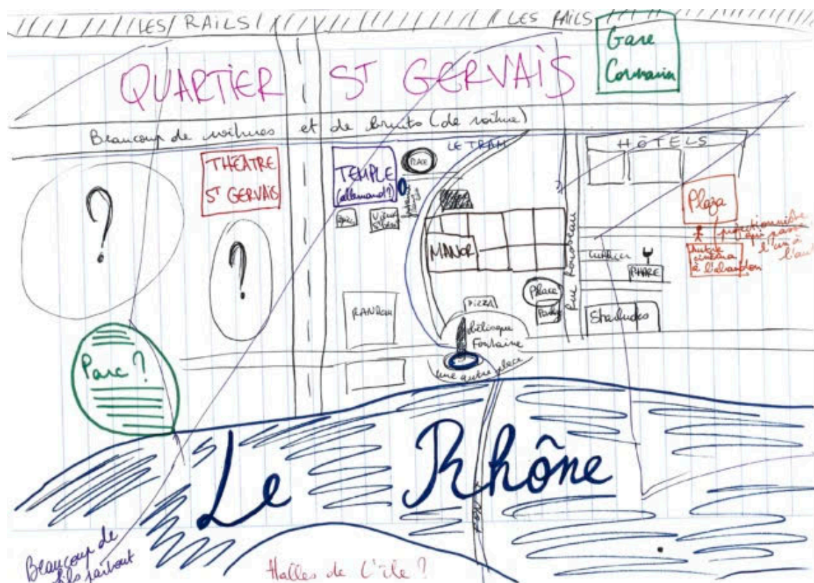
Figure 1 : Carte mentale du quartier Saint-Gervais

Parallèlement, les comédien·ne·s étaient invité·e·s à produire, en début de recherche, une carte mentale papier du quartier.