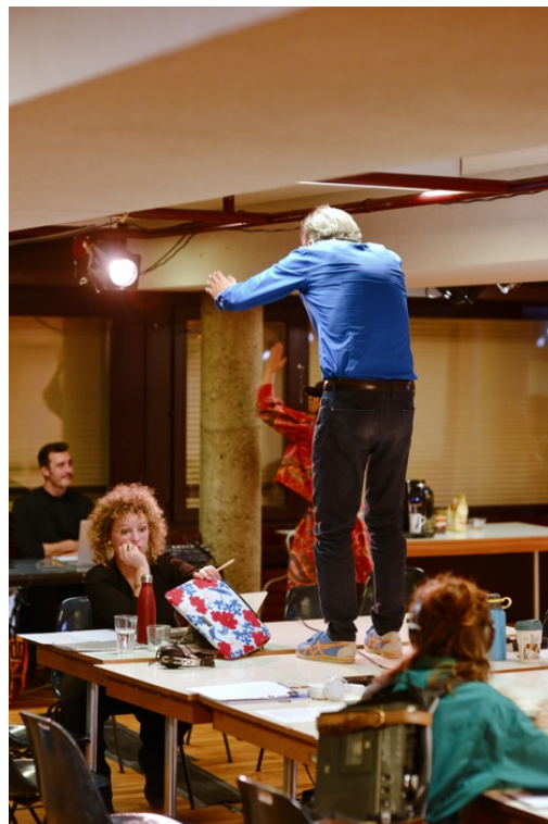
Figure 3 : Photographie de la cartographie performée, Tomason , 2021

Un glissement allant de l'enquête à la performance s'effectue lentement. Alors que les projecteurs de théâtre s'allument, les néons s'éteignent. Les comédien-ne-s entament la scène de spatialisation de leurs cartes du quartier (figure 3), en simultané. La qualité du jeu donne alors un effet d'improvisation et d'erreurs, iels semblent chercher dans leurs souvenirs, les observations, les odeurs, les anecdotes, et inventer en direct.