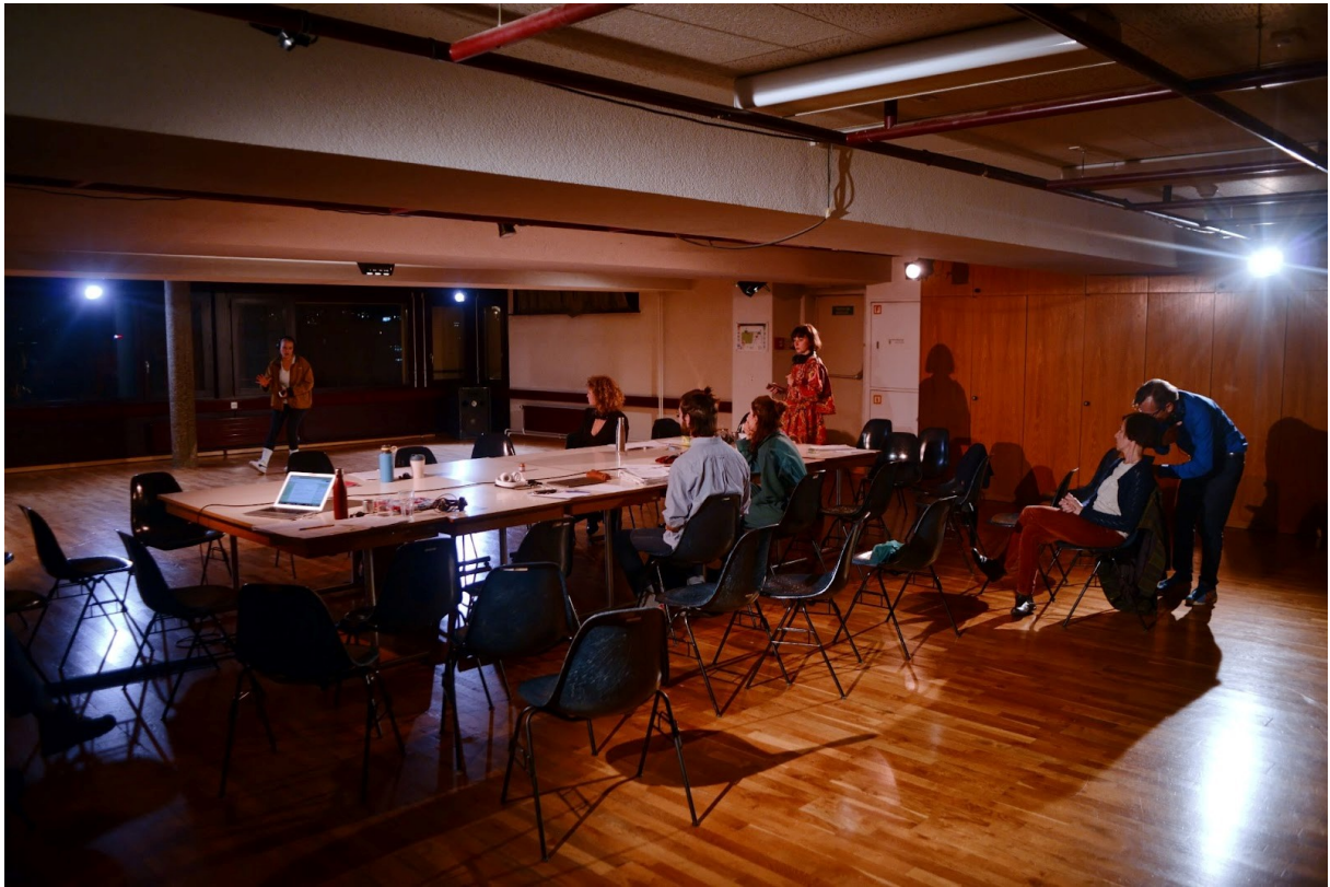
Figure 2 : Photographie de la performance Tomason , 2021