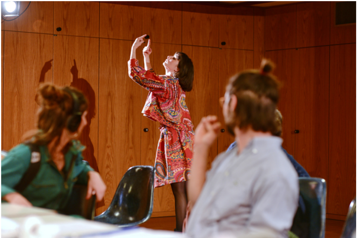
Figure 4 : Photographie du re- enactment de la marchande, Tomason , 2021

Des traces de l'enquête parsèment la performance et jouent sur les juxtapositions d'écritures fragmentaires et minoritaires (Deleuze et Guattari, 1980). Si le géographe et la créatrice sonore parlent depuis leur position professionnelle, les comédien-ne-s passent de leur propre rôle à la composition de personnages (figure 4), leurs textes étant puisés dans les paroles brutes de l'enquête, les leurs et celles des complices/enquêté-e-s. Lorsque la comédienne restée jusque là silencieuse prend pour la première fois la parole, c'est avec des mots qui ne sont visiblement pas les siens, mais bien ceux d'un personnage qui parle du quartier.