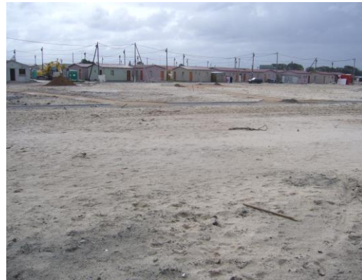
Photographie 2 : Le quartier de New Rest, en marge de Gugulethu, (30/08/08). Le sable est partout présent sur les Cape Flats , dont le nom même indique la platitude ( flat ).