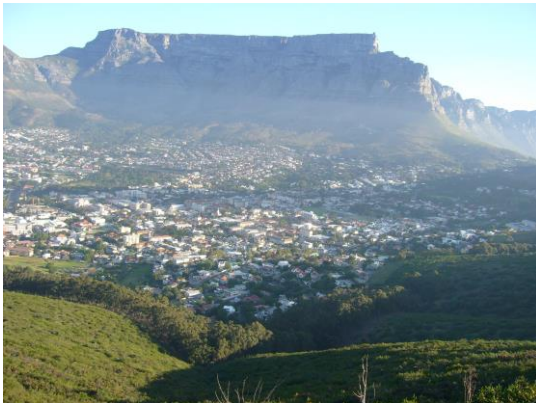
Photographie 1 : La Montagne de la Table vue depuis Signal Hill (04/03/09). Le site en cuvette vaut au centre-ville le surnom de « bol urbain » ( city-bowl ) et renforce l'impression d'un cocon d'aisance isolé du reste de l'agglomération.

Photographies 1 et 2 : Le centre-ville et les Cape Flats, quand la topographie accentue les différences socio-économiques.