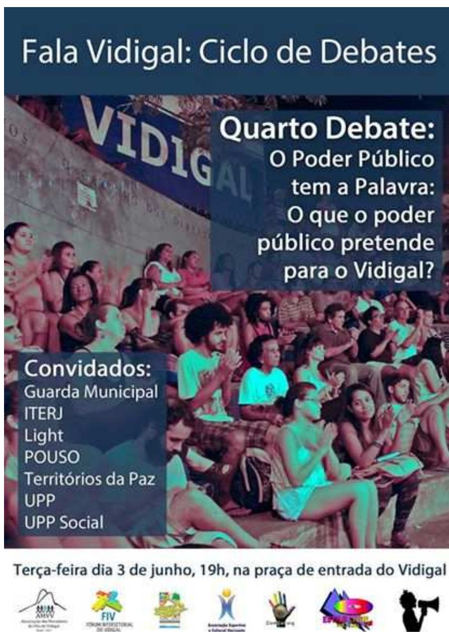
Illustration 4 : Affiche du débat mensuel organisé par l'association des habitants et les organisations locales, présence de représentants des pouvoirs publics (police civile, UPP, urbanistes, programmes sociaux de l'Etat et de la municipalité, compagnie d'électricité) 4