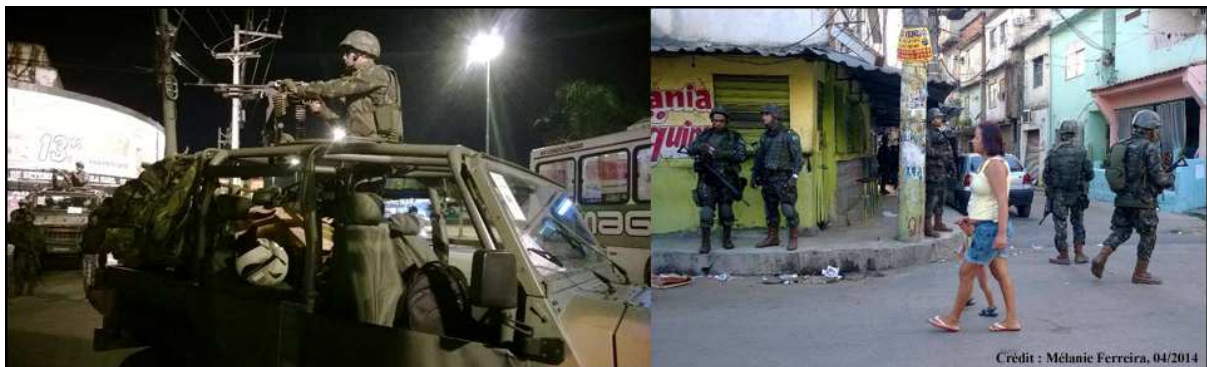
Illustration 2: avril 2014, l'armée venue en renfort lors de la pacification du complexe de favelas de Marê, situé dans la zone nord de Rio de Janeiro.

La présence quotidienne de policiers armés dans les rues des favelas pacifiées contraint les habitants à s'adapter à de nouvelles règles et pratiques sociales qui peuvent susciter au départ une certaine résistance; ce qui avant était résolu par les groupes criminels l'est aujourd'hui par la police. L'élargissement des fonctions dévolues à la police désoriente une partie de la population quant au comportement à adopter face à des policiers à la fois détenteurs de la violence légitime, médiateurs et parfois même éducateurs. Il y aurait un transfert de responsabilités de gouvernance aux UPPs. Si pour certains habitants l'introduction de policiers armés dans l'espace