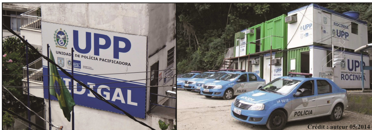
Illustration 1: postes d'UPP à Vidigal et à Rocinha, Justine Ninnin, 2014

En 2008, le Secrétariat de Sécurité Publique de l'État de Rio de Janeiro élabore la politique dite de «pacification», visant à reprendre le contrôle des territoires dominés par des groupes criminels et à améliorer les rapports entre la population et les policiers en mettant en place une occupation permanente par des Unités de Police de Pacification (UPP). Ces opérations mobilisent de jeunes policiers récemment engagés, afin d'éviter les anciennes pratiques de corruption, ils reçoivent une prime mensuelle ainsi qu'une formation spécifique sur les principes de la police communautaire.