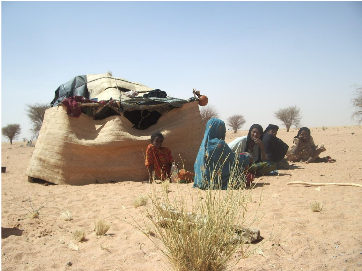
Photographie 3 : Campement à Alkhuriya à l'intérieur du permis d'exploitation d'Imouraren

propre travail de terrain, il existe plusieurs campements exploitant les pâturages dans la zone du permis et cela même pendant la saison sèche.