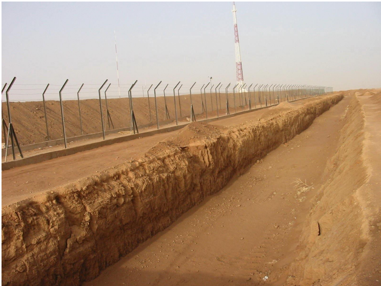
Photographie 4 : Clôture du site Areva d'Imouraren (copyright A. Afane)

Cette extraterritorialité est encore plus manifeste dans l'exploitation des sites miniers chinois. Celle-ci se fait dans des conditions d'exception encore plus explicites, au mépris des pratiques locales mais aussi des lois nationales nigériennes. L'ONG Aghir in'man voit dans les compagnies chinoises « le même mode opératoire », fait « d'opacité » et de « piétinement des lois nigériennes », au détriment d'une industrie minière « qui s'intègre convenablement dans les territoires où elle s'implante » 27 . Le rapport de l'étude d'impact environnemental du projet de raffinerie de pétrole au bloc d'Agadem (par la compagnie chinoise CNPC) a été réalisé à la hâte par des experts chinois d'après les normes environnementales et la législation chinoises. En outre, certains ingénieurs nigériens, formés en Chine, ont refusé de signer le contrat de travail pour la SOMINA, filiale d'une société chinoise exploitant les mines d'uranium d'Azélik : ils sont en effet sous-payés par rapport à leurs collègues travaillant pour les filiales d'Areva et doivent se plier aux horaires et aux conditions de travail et de rémunération imposées en Chine et externalisées au Niger 28 . Tout se passe avec les sites d'exploitation chinois comme si ces espaces extraterritoriaux jouissaient d'une grande autonomie par rapport à la souveraineté nationale et d'une pleine autonomie par rapport au milieu local.