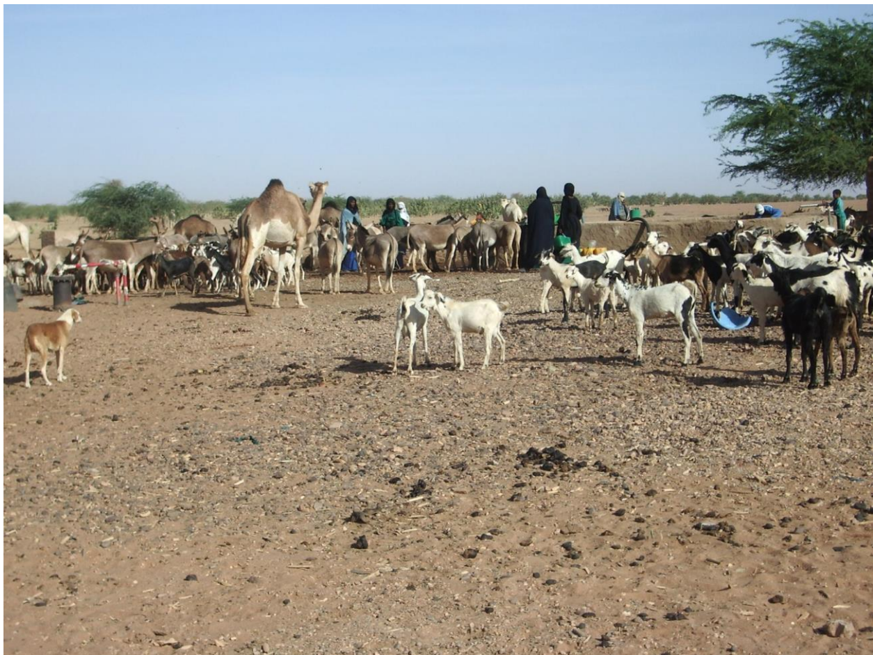
Photographie 1: Troupeaux au puits de Tchit n taghat

groupes de passage, l'abreuvement est autorisé, mais il est de plus en plus soumis à une redevance en nature ou en espèces. En outre apparaissent aussi des puits que l'on appelle généralement dans l'Eghazer « puits-boutique ». L'objectif est d'accaparer ou de construire un puits dans un espace pastoral que l'on s'approprie par ce geste. Le propriétaire fait construire une petite « maison » en banco (adobe) à côté du puits, qui est transformée en boutique ( kantî ) vendant des produits alimentaires (mil, riz, semoule de blé, sucre, thé, etc.) ou manufacturés (tissus, piles, sandales, etc.). On parle alors du puits d'un tel ( anu n mandam ). D'autres pasteurs s'installeront sur les lieux : ce processus aboutit à la fixation du campement autour du puits et à sa transformation en « village », qui cherchera à se faire reconnaître comme tel par l'administration grâce à l'appui d'une personnalité politique. En retour, les villageois seront considérés comme clients et protégés de cette dernière, et les votes lui seront acquis.