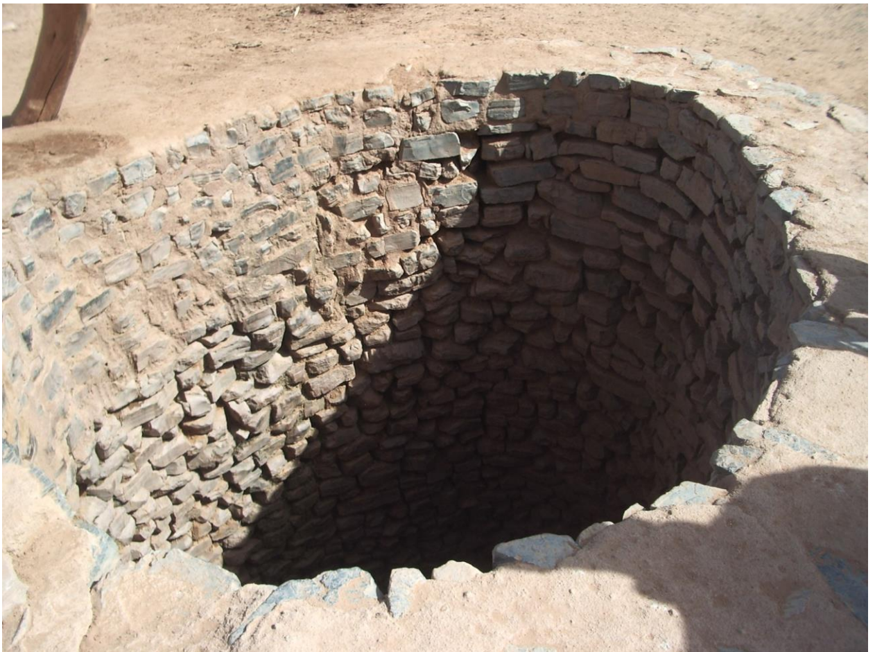
Photographie 2 : Puits traditionnel d'Alkhuriya, dans la zone d'exploitation du permis d'Imouraren.

Le problème foncier est déjà réglé pour Areva. Selon le porte-parole d'Areva, les nomades de la zone n'auraient pas de biens fonciers, mais se partageraient, ou plutôt « défendent », de simples zones de pâturages se limitant uniquement aux rives des koris ; donc aucune expropriation, ni aucune « gêne », ni même « risque » de gêne pour les nomades : « le droit foncier n'étant pas abouti au Niger - même si l'Etat est en train de mener une réflexion de fond sur le sujet -, peu de personnes possèdent un terrain dans les deux tiers nord du pays. Si les populations locales, majoritairement nomades, n'ont quasiment pas de biens fonciers, elles défendent en revanche des zones de pâturages, qui se situent au niveau des oueds [...]. Un sujet sur lequel nous avons beaucoup travaillé. Nous avons organisé plusieurs journées d'audience publique et nous avons réussi à délimiter une surface d'exploitation qui ne risque pas de gêner les éleveurs » 21 . En accord avec l'Etat nigérien et moyennant une redevance annuelle pour les collectivités locales, Areva s'est donc adjugé une zone réservée et délimitée en excluant de facto les nomades par une lecture restrictive et partielle du décret sur les terroirs d'attache (ce qui leur permet en outre de nier le fait de relever de l'objet de l'article 9 dudit décret). Sous prétexte qu'il n'y a pas de terroir d'attache dans la zone d'Imouraren (en omettant consciemment celui d'Alkhuriya), la