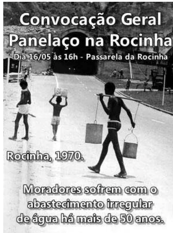
Illustration 3 : Tracte d'appel au rassemblement pour manifester à Rocinha Convocation générale, le 16/05/2014, Passerelle de Rocinha. Rocinha, 1970, les habitants souffrent de l'approvisionnement irrégulier en eau depuis plus de 50 ans.

Néanmoins, les pouvoirs publics prônent de plus en plus un modèle inclusif de participation, en marquant leur volonté d'articulation entre les différents mouvements de revendication et les services publics ainsi que privés agissant pour l'amélioration des conditions de vie dans les favelas. Récemment, on a vu s'organiser des débats entre habitants, leaders communautaires et pouvoirs publics, toutefois, la présence des résidents reste limitée.