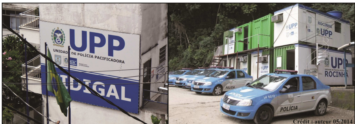
Illustration 1: postes d'UPP à Vidigal et à Rocinha, Justine Ninnin, 2014

En 2008, le Secrétariat de Sécurité Publique de l'État de Rio de Janeiro élabore la politique dite de «pacification», visant à reprendre le contrôle des territoires dominés par des groupes criminels et à améliorer les rapports entre la population et les policiers en mettant en place une occupation permanente par des Unités de Police de Pacification (UPP). Ces opérations mobilisent de jeunes policiers récemment engagés, afin d'éviter les anciennes pratiques de corruption, ils reçoivent une prime mensuelle ainsi qu'une formation spécifique sur les principes de la police communautaire.