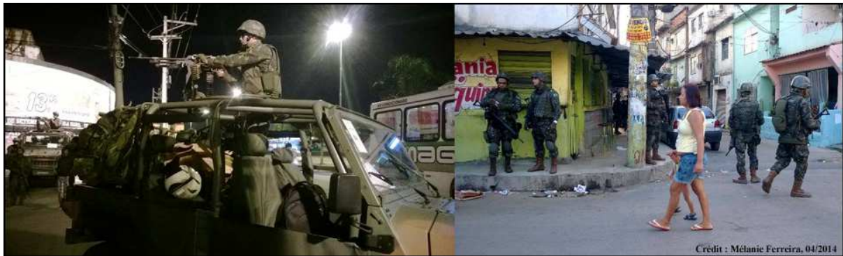
Illustration 2: avril 2014, l'armée venue en renfort lors de la pacification du complexe de favelas de Marê, situé dans la zone nord de Rio de Janeiro.

La présence quotidienne de policiers armés dans les rues des favelas pacifiées contraint les habitants à s'adapter à de nouvelles règles et pratiques sociales qui peuvent susciter au départ une certaine résistance; ce qui avant était résolu par les groupes criminels l'est aujourd'hui par la police. L'élargissement des fonctions dévolues à la police désoriente une partie de la population quant au comportement à adopter face à des policiers à la fois détenteurs de la violence légitime, médiateurs et parfois même éducateurs. Il y aurait un transfert de responsabilités de gouvernance