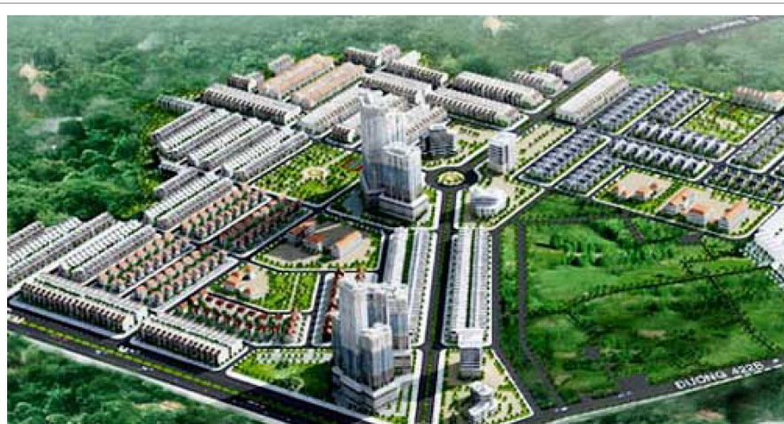
Illustration 3. Modernité urbaine, zonage fonctionnel et exclusivité: la stratégie marketing des nouvelles zones urbanisées