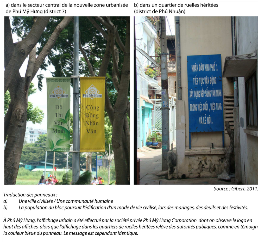
Illustration 1. Les réglementations associées aux programmes des « quartiers civilisés » à Hồ Chí Minh Ville